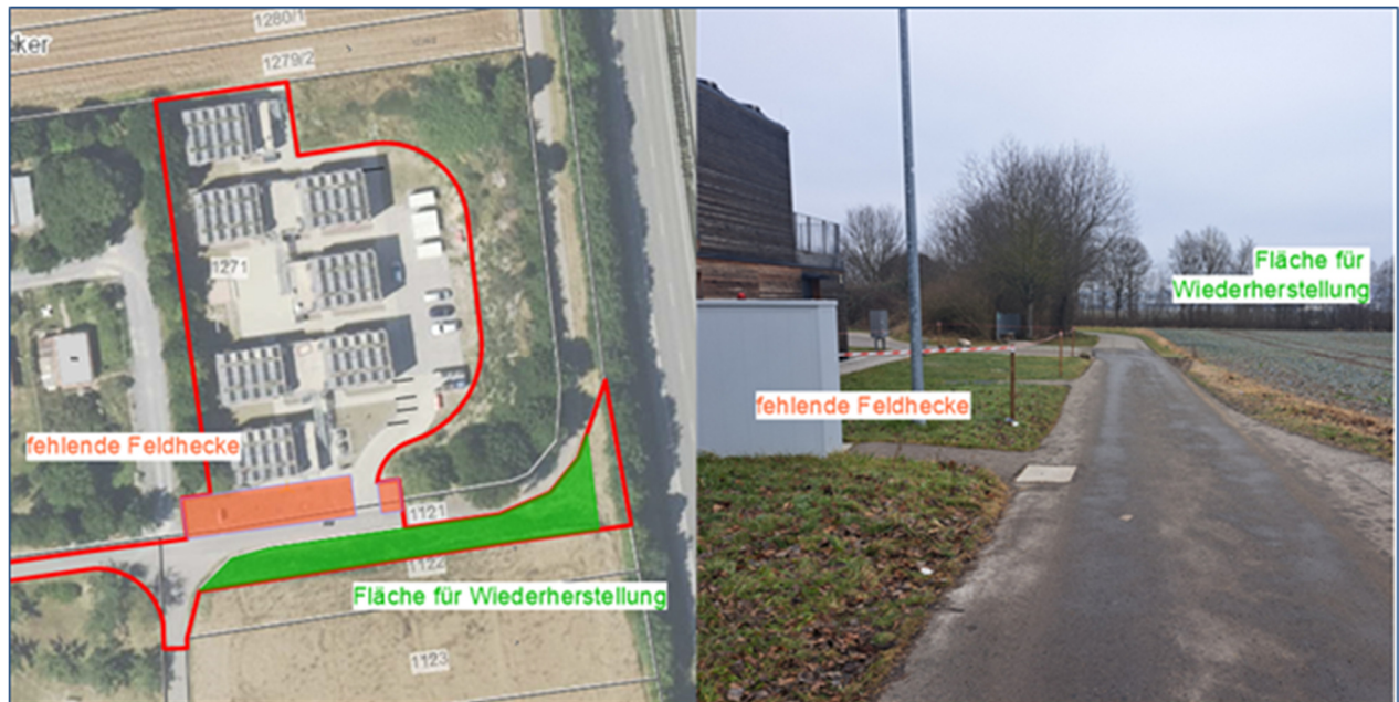
Abb. 2 entfallene Feldhecke (orange) sowie Fläche für die Wiederherstellung der Hecke (grün)

Die Neuanlage der Feldhecke erfolgt linear entlang des Flurwegs 1121 und umfasst nur einen kleinen Bereich des Flurstücks 1122, so dass eine landwirtschaftliche Nutzung der Restfläche ungehindert möglich ist. Für die Erschließung der Ackerfläche vom Flurweg 1121 aus verbleibt im Osten eine Fläche ohne Bepflanzung. In diesem Bereich verläuft auch eine Fernwasserleitung. Im Flächennutzungsplan ist die derzeit noch als Acker genutzte Fläche als Grünfläche mit der Zweckbestimmung Sportplatz vorgesehen. Die Feldhecke kann dann dauerhaft als Eingrünung für die späteren Sportanlagen dienen.