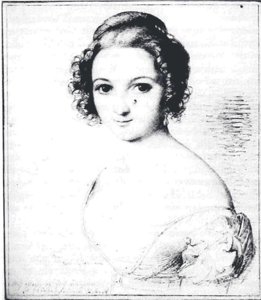
Im Präzeptorenhaus am Aufgang von der Marktstraße zum Böblinger Schloß zur Welt gekommen, wurde Friederike Robert geb. Braun später im Berliner Salon ihrer Schwägerin Rahel Varnhagen zur umschwärmten „Schönen Friederike“. Zeichnung von Wilhelm Hensel.