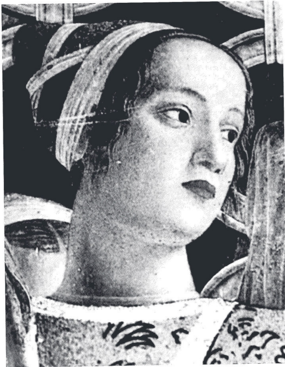
Der Ausschnitt aus dem Fresco Andrea Mantegnas im Schloß von Mantua zeigt das Bild der jungen Barbara Gonzaga noch vor ihrer Heirat mit Graf Eberhard im Bart.