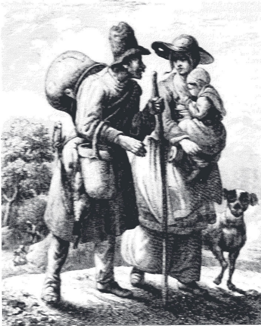
Eine alte Lithografie zeigt dies Keßlerpaar auf der Wandschaft; die Frau trägt ihr Kind mit sich, er die Utensilien seines Handwerks.