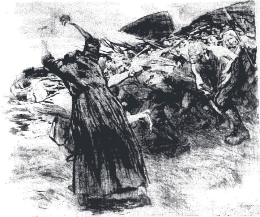
Der Deutsche Bauernkrieg von 1525 war nicht nur Männersache. Eine der Frauen, die im Bauernheer mitzogen und die für die Bauern so verhängnisvolle Schlacht bei Böblingen am 12. Mai 1525 miterlebte, war die „Schwarze Hofmännin“, hier auf der Radierung von Käthe Kollwitz.