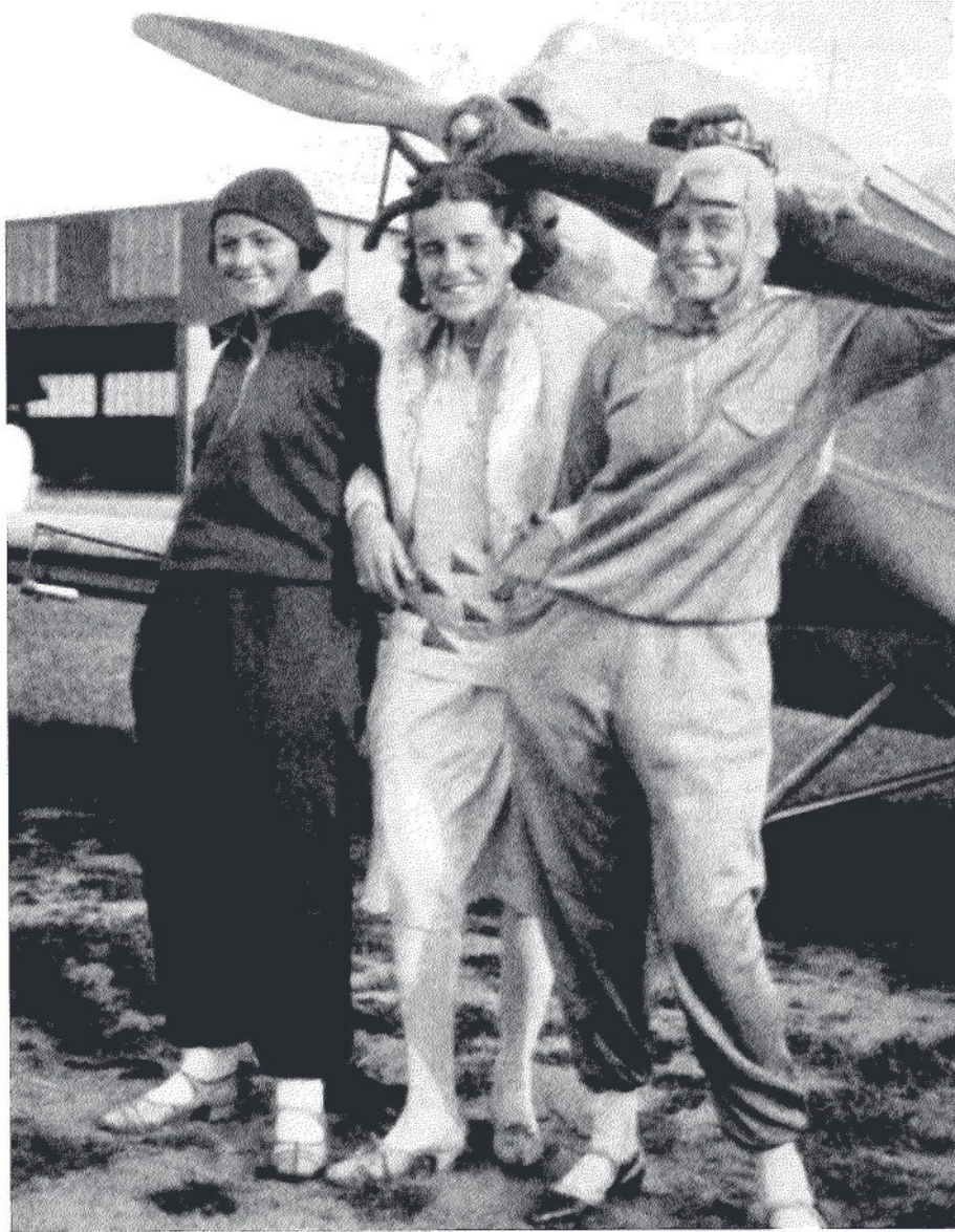
Elly Beinhorn (rechts) mit zwei Fliegerkameradinnen auf der Fliegerschule in Berlin-Staaken vor einer in Böblingen gebauten Klemm L 20.