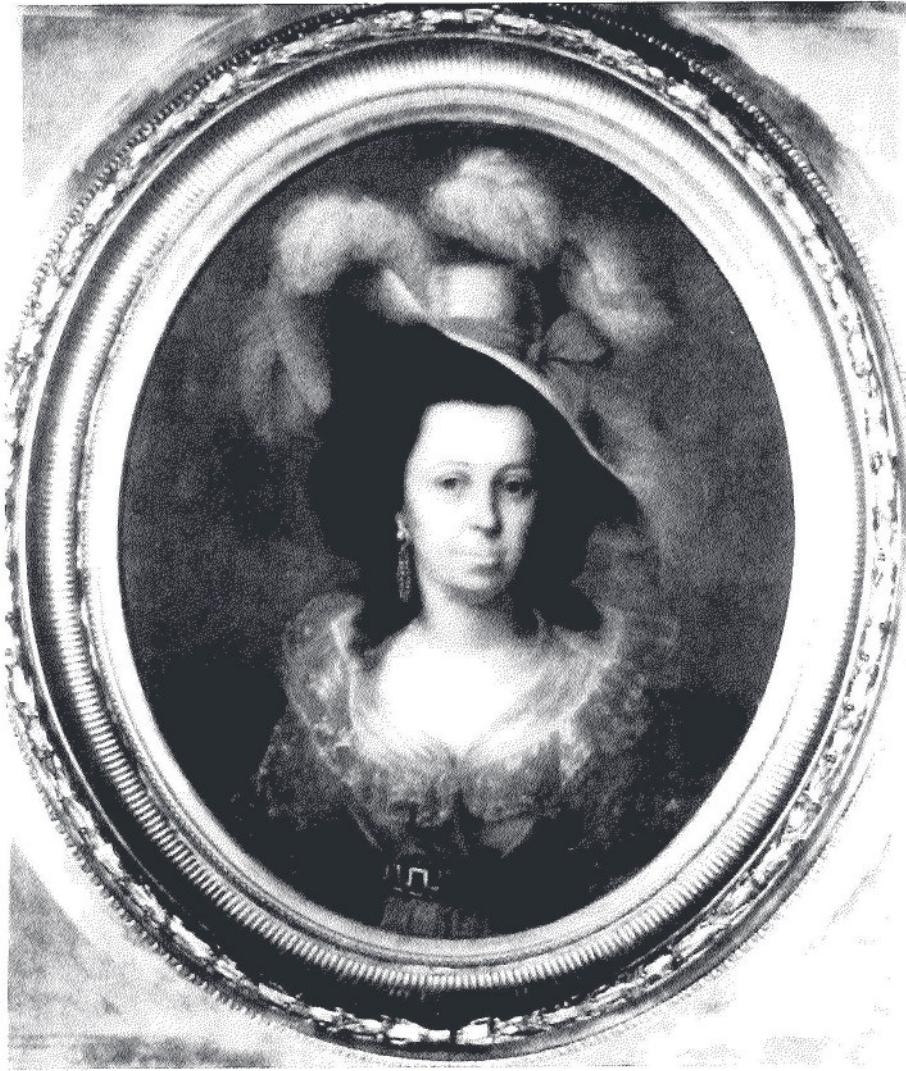
Läuternden Einfluß auf Herzog Carl Eugen übte die Reichsgräfin Franziska von Hohenheim aus, die ihn oft auf seinen Jagdausflügen begleitete. Gemälde von Jakob Friedrich Weckherlin um 1790.