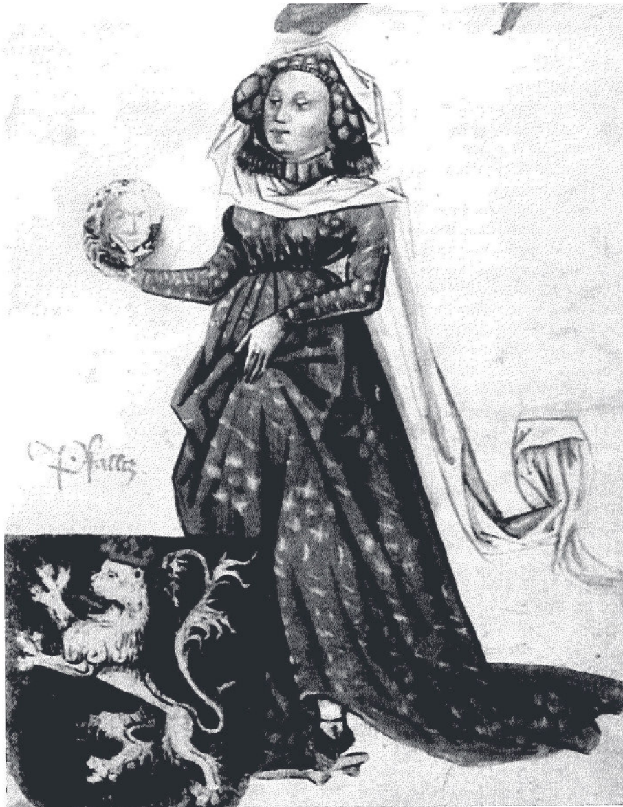
Gräfin Mechthild im Jahr 1452, in dem sie in Böblingen Erzherzog Albrecht VI. von Österreich geheiratet hat. Das Bild ist dem im Kunsthistorischen Museum Wien archivierten Codex Ingeam entnommen.